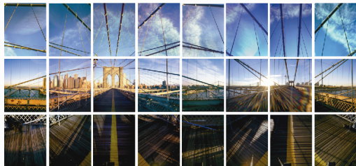
《Gleaning Light シリーズより Brooklyn Bridge》2005年