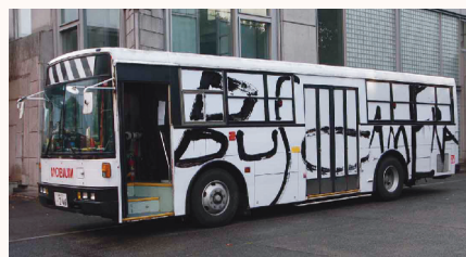
《サイトシーイングバスカメラ 京都》

遮光した両側の窓にレンズをつけ、カメラの構造になったバス。そんなバスに乗り、不思議な動く映像を体験してみませんか? 運行時間: 12:00~16:00(1時間間隔、1日5本運行) 定員: 10~15名程度(1回の乗車人数。乗車時間約20分) 発着場所: 茅野市民館東口ロータリー(予定) 協力: 三友周太(Ray Project)、諏訪バス株式会社 ※参加費100円(共通バス持参者は無料) 要事前申込み