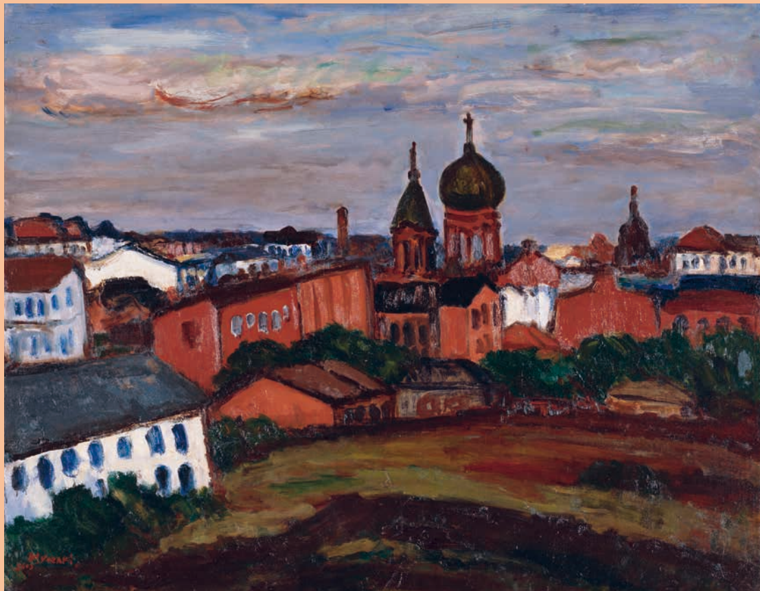
矢崎牧廣《ハルビン風景(一)》1943年