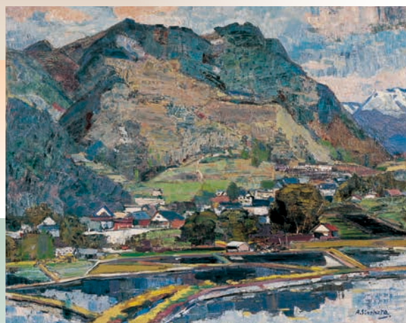
篠原昭登《和田村五月》1994年

Chino Cultural Complex Chino City Museum of Art