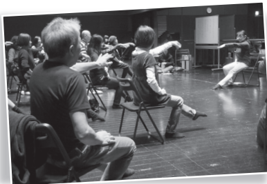
↑ 2019年の演劇ワークショップより。 椅子に座ったまま踊って楽しむワーク。

1/27(土)・28(日)・ 2/3(土)・5(月)・10(土) 無料・要事前申込み