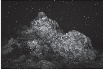
山内悠《planet N45°42'13.1” E107°11'51.9”-#01》2018年