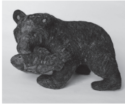
橋口優 《和解～木彫りの熊～》 2023年