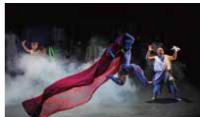
このプロジェクトは千葉県流山市、東京都多摩市、石川県金沢市、長野県茅野市、宮城県仙台市の公共館5館による地域連携事業です

古代インド叙事詩「マハーバーラタ」を、バリ舞踊・タイ舞踊・インド古典舞踊・京劇・琉球舞踊・コンテンポラリーダンス・アクトバットなど、異なる背景を持つアーティストの融合による舞台表現でお届けする、シアターを超えた「スーパーシアター」。