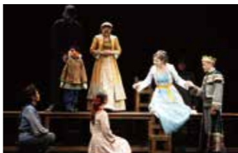
『冬物語』(2011年)