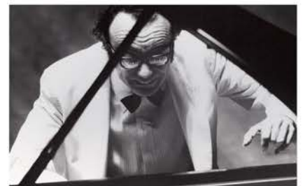
「アルフレッド・ブレンデル」1974年

第2期収蔵作品展「音楽写真家 木之下見」 9/6[日]—10/26[月] 「寿齢讃歌」を美術館サポーターとともに推進してきた写真家・木之下見(2015年1月逝去)の作品を特集します。 関連講座 9/23[水・祝] 14:00 講師：松本徳彦(写真家、日本写真家協会副会長)