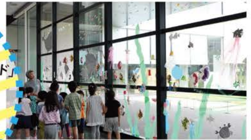
「vol.16 ギョ・ギョ・魚! ワールド」(2015.6.20)