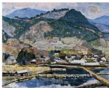
「朝倉山五月」1990年 長野県信濃美術館蔵

関連企画 作家によるギャラリートーク 8/1[土] 14:00 美術を語る「篠原昭登」 8/29[土] 14:00 ※無料(要展覧会チケット)