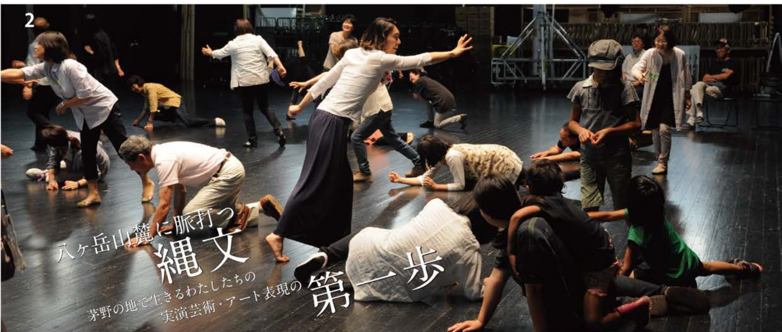
1 「茅野市民館 10 周年記念パーティー-じよもバ」(2015.4.26) 2 パフォーミング・アーツの創作活動より (2015.5.31)

茅野市民館、茅野市美術館の取り組みをご紹介します「茅野市民館 通信 CCC News Letter」 2015 年度上半期の主催・共催事業を中心にお届けします