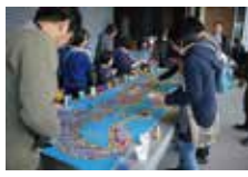
アートワークショップの様子 (2017.4.2)